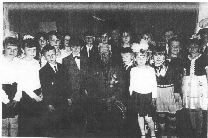
На сустрэчы са школьнікамі У цэнтры — ветэран